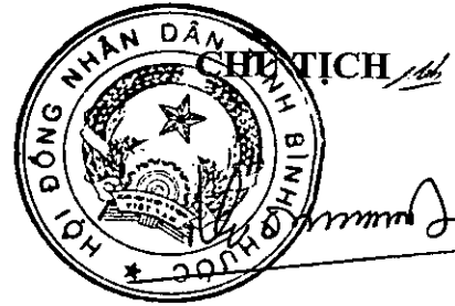
Trần Tuệ Hiền

2. Đối với các huyện, thị xã, thành phố thực hiện không quá 80% mức chi để thực hiện chế độ dinh dưỡng đối với huấn luyện viên, vận động viên thể thao và chế độ chi tiêu tài chính đối với các giải thi đấu thể thao tương ứng của cấp tỉnh tại Quy định này./.